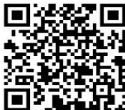
1.会计师事务所设立审批