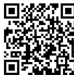
财政权力事项清单